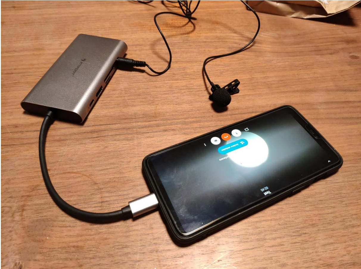
Abbildung 2: Solide Sendeeinheit