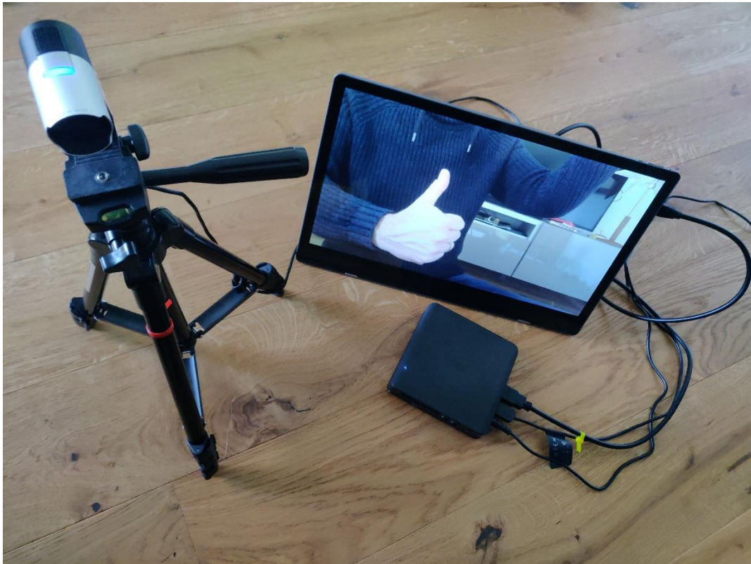
Abbildung 3: PC-basiertes Setup

Hier noch eine etwas bessere Konfiguration für HD Streaming.