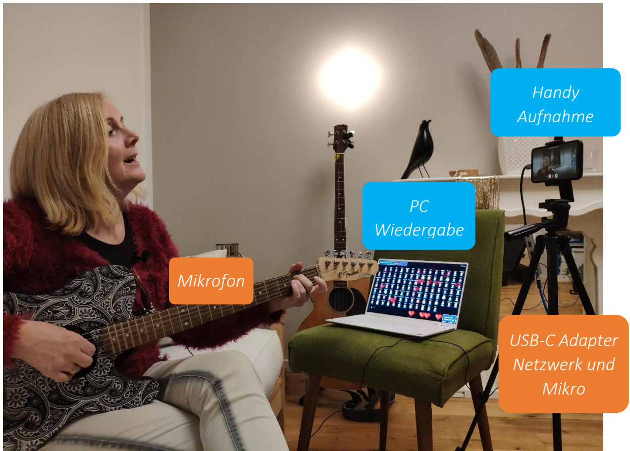
Abbildung 1: Ministage Aufstellung

Das folgende Bild zeigt die Aufstellung: